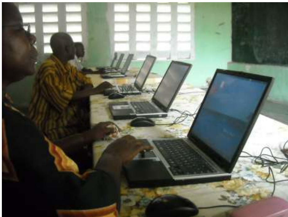
Leraars in Kingandu tijdens een computerinitiatie in de nieuwe computerklas.

Op 18 januari heeft ons jaarlijks Nieuwjaarsconcert plaats (zie aankondiging in dit nummer). FR