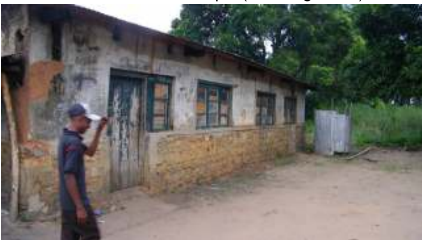
De oude jongensslaapzaal in Totshi.

In september, bij het begin van het Congolese schooljaar, werden, in opvolging van de zending "Ateliers de Réflexion" van april (zie Nsangu nr 15), door de schooldirecties verschillende initiatieven opgezet voor een betere begeleiding van de leerlingen, leraars en ouders (project ONDI4/003).