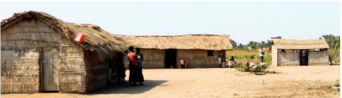
Kakobola, buitenpost van Totshi (materniteit consultatie, vergaderplaats)

Erwin heeft in juni van dit jaar een tocht gedaan door alle medische initiatieven van de zusters annutiaten en heeft het ter plaatse kunnen vaststellen. In de Congolese gezondheidszorg heerst meer chaos. Er loopt veel te veel personeel rond (opgedrongen aanwervingen) maar weinig efficiëntie. Er moet evenzeer worden