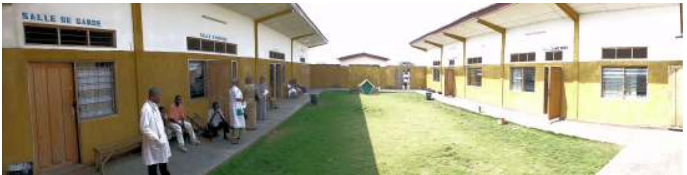
Kibangu, binnenkoer inwendige ziekten

Het contrast tussen de gezondheidszorg in het Noorden en in het Zuiden is bijzonder scherp. Maar het probleem zit niet zozeer in de kennis (weten hoe het moet) maar in de toepassing en deze laatste wordt in sterke mate bepaald door 'het systeem'. Zo 'weten' artsen in Rwanda vaak even veel als deze in Congo maar de omstandigheden in Congo maken het ontzettend moeilijk om op een kwaliteitsvolle manier te werken. In Rwanda bijvoorbeeld mogen mensen buiten hun huis niet op blote voeten lopen, ze mogen buiten niet roken, bevallingen moeten verplicht gemeld worden zodat verdere begeleiding van de moeders en de babys systematisch kan volgen. Dat heeft tot gevolg dat Rwanda meer fondsen binnenrijft omdat men strikt de regels van de Wereldgezondheidsorganisatie volgt. Congo loopt door de chaos veel financiële steun mis.