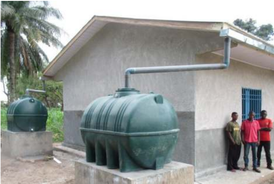
De nieuwe jongensslaapzaal in Totshi met regenwaterrecuperatie voor huishoudelijke klusjes.