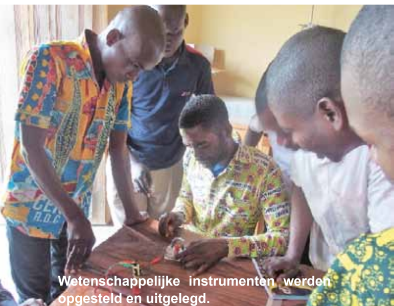
Wetenschappelijke instrumenten werden opgesteld en uitgelegd.