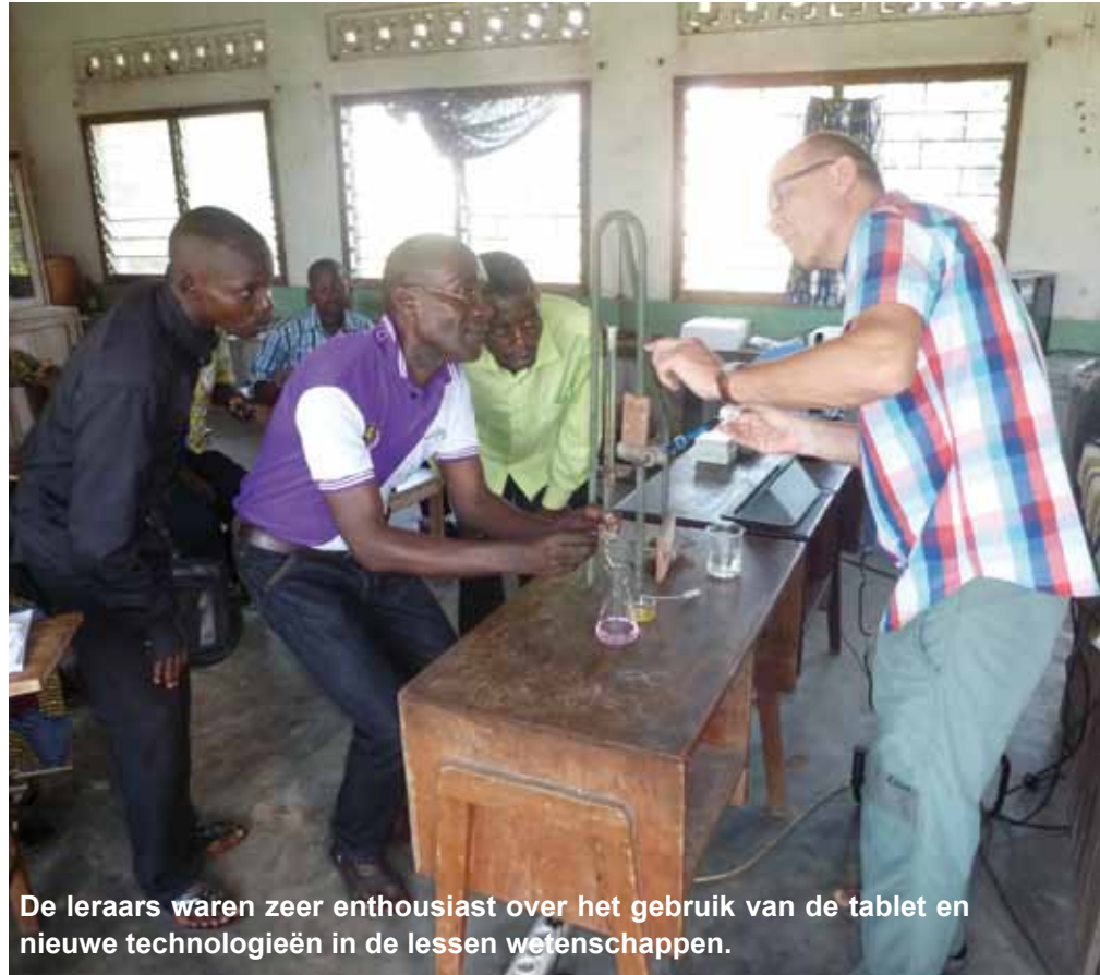
De leraars waren zeer enthousiast over het gebruik van de tablet en nieuwe technologieën in de lessen wetenschappen.

Verder toonden we hoe zij video's zoals "C'est pas sorcier" en youtube films in de lessen kunnen gebruiken en leerden zij foto's en films maken van eenvoudige experimenten.