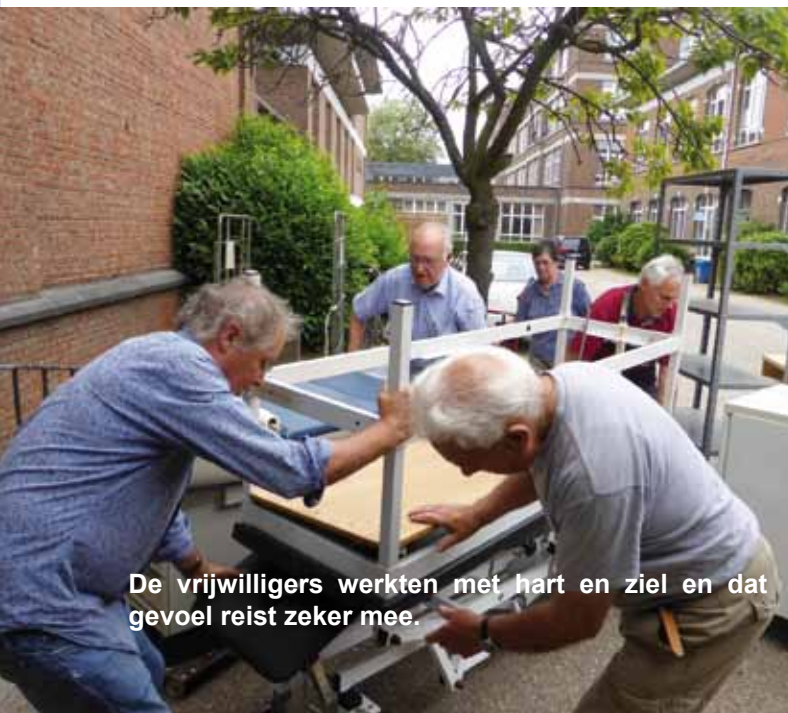
De vrijwilligers werkten met hart en ziel en dat gevoel reist zeker mee.

Ook in Kameroen gaat voor niets de zon op, al het andere kost heel veel geld. Voor dit mooie gezondheidsproject echt kan starten, gaan het transport van het materieel en de formaliteiten nog een flinke hap uit ons budget nemen. Maar u kunt de zusters Annunciaten en de vrijwilligers die er al zoveel energie in stopten, ondersteunen door een financiële bijdrage die integraal in de goede afloop van deze onderneming wordt geïnvesteerd. Aan het eind van het verhaal is de Kameroen die in het gezondheidscentrum wordt geholpen u dankbaar.