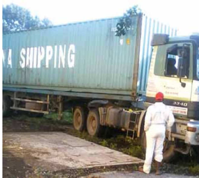
Van Heverlee naar Foumbot